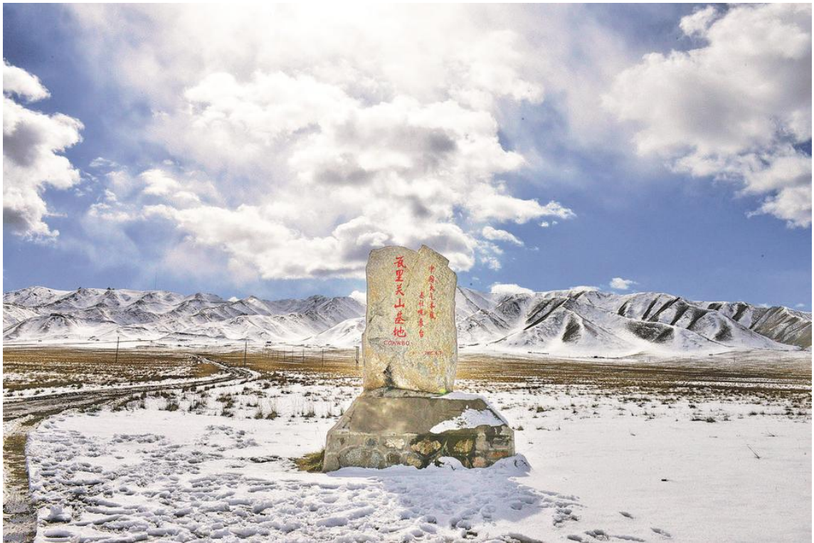
雪后初晴的瓦里关山，方圆 40 公里的环境保护区内没有任何污染，是大气成分观测的神圣净土。