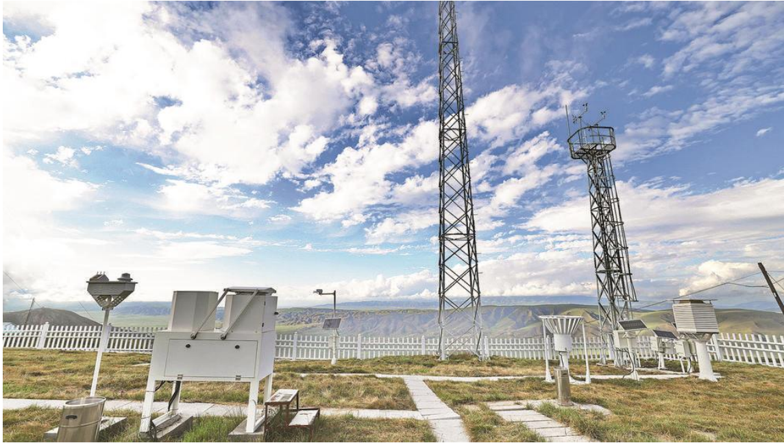
瓦里关本底台自动观测站。