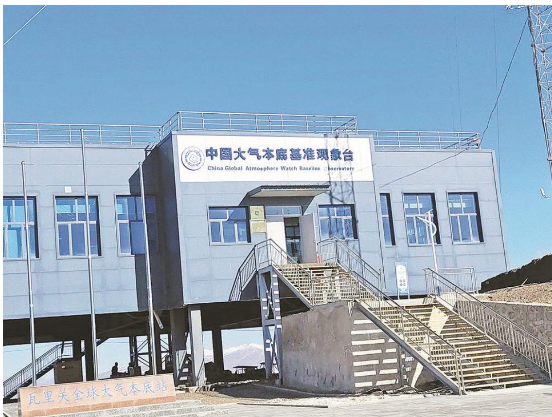
瓦里关本底台业务楼。