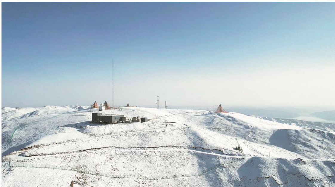
俯瞰中国大气本底基准观象台。